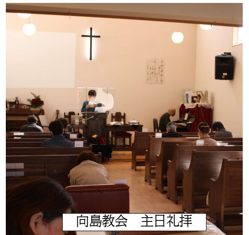
向島教会 主日礼拝