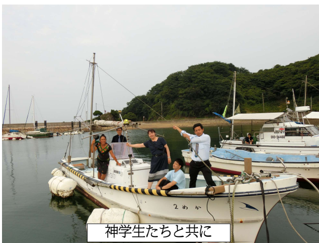
神学生たちと共に

大三島や佐木島など近場で動かし、狭い係留先での出港／入港を繰り返しながら、「祈里丸」とも親しくなり、中