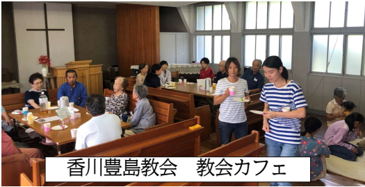
香川豊島教会 教会カフェ