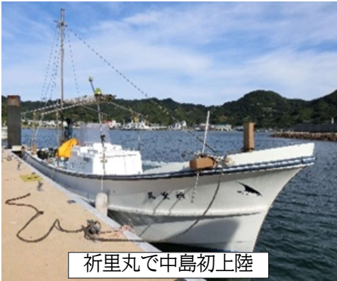
祈里丸で中島初上陸