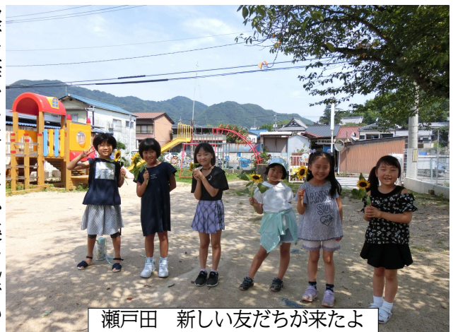
瀬戸田 新しい友だちが来たよ

このような時期ですが、世間の動き とは反対に、教会学校の子どもたちが 集まってきています。九月には、12名 になりました。礼拝と交わり、時に分