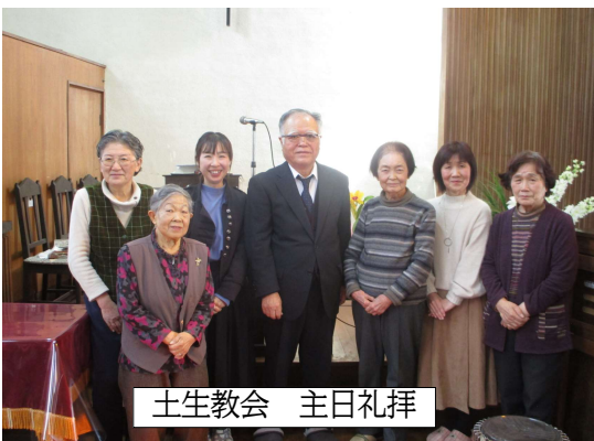
土生教会 主日礼拝

教会定例役員会は、第四週の礼拝後に行います。牧師、責任役員、女性会長、CS校長、会計監査が出席します。今月は寒さ対策のため、換気システムを導入するかどうか等を協議しました。高額のため導入せず、空気浄化装置と灯油ストーブを購入し、厳寒期に備えることにしました。その時は前後に換気と暖めを行い、礼拝を1時間以内に収めることにしました。伝道のためのコンサート等を実施したいとの案も出しましたが、コロナ感染状況を考え、無理との結論になりました。(大谷孝志)