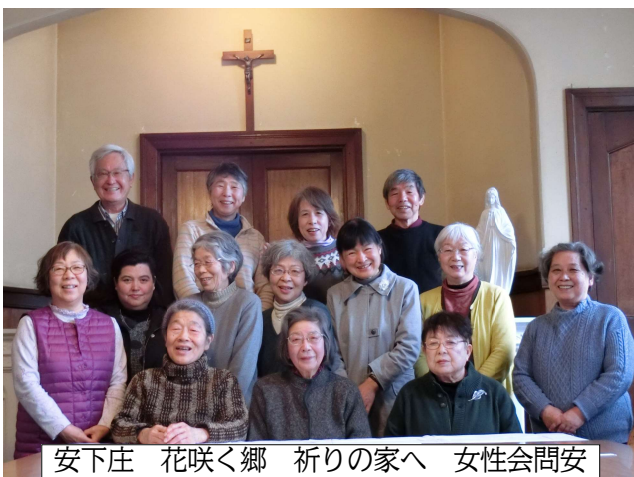
安下庄 花咲く郷 祈りの家へ 女性会問安

山口県の柳井教区の神父さんが月2回水曜日にもミサを司式しておられるそうです。なんとその神父さん、私が長い間 治療して、助けてもらっていた鍼灸師さんをよく知っておられました。私はその方の葬儀のミサに参列したことがあるのですが、その司式をされていたのだから。不思議な出会いに感激しました。プロテストメントの私たちに、分かりやすい説明を入れながら話してくださいました。