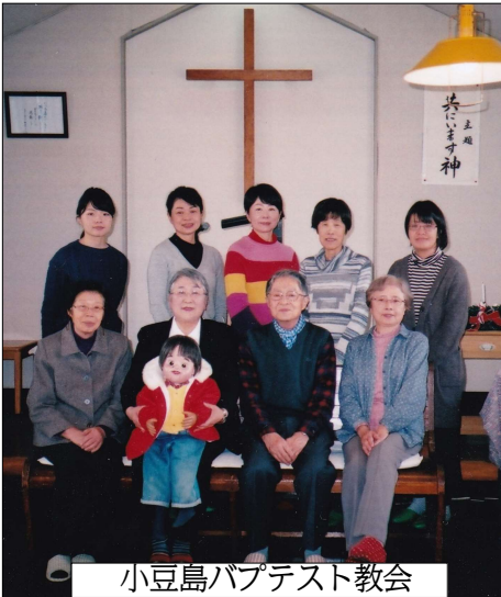
小豆島バプテスト教会

主によって選ばれし、故ビツケル船長の時かれた福音の種が芽生え、育ち、最初の伝道地、小豆島教会は120年の歴史になります。「福音は、すべて信じる者に、救いを得させる神の力