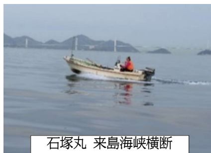
石塚丸 来島海峡横断