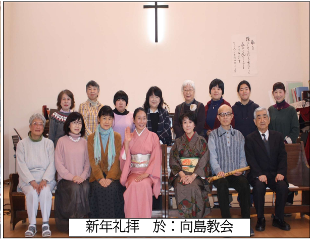
新年礼拝 於：向島教会