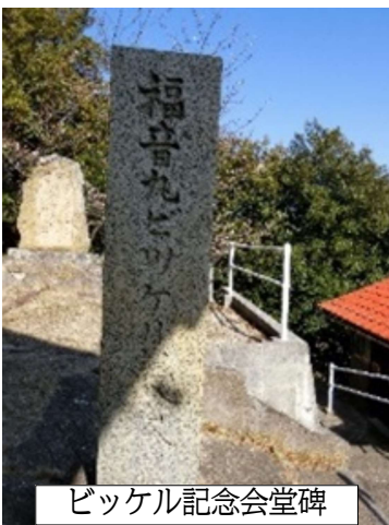
ビッケル記念会堂碑