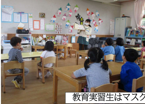
教育実習生はマスクを着けて部分実習