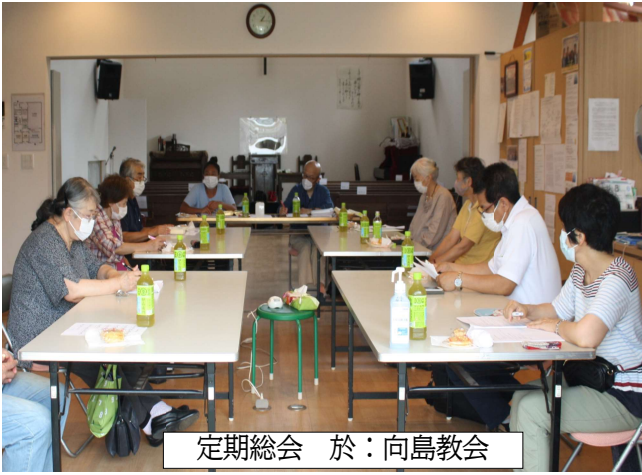
定期総会 於：向島教会