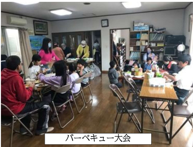
バーベキュー大会

子ども達が多いので、第一、第二礼拝と分け、第一は大人で、第二礼拝は子ども達で行います。第一は、今までより静かな礼拝ですが、第二は、子ども達の元気な歌声で賛美されています。昨年より、広島宣教協力会の提案で、広島市の教会に呼びかけ、みんなで大きなホールで礼拝をという話だったのですが、コロナの関係でリモートで十