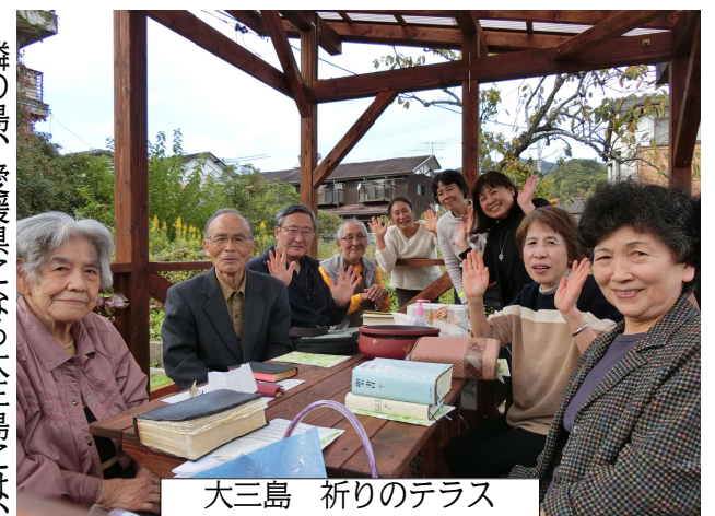
大三島 祈りのテラス

昨年十月初めに何も無い土地で起工式をしてから、工事関係者のご都合もあり、実際にテラス工事にかかったのは、三月に入ってからでした。しかし、丁寧に、かつ、早く建設が進み、四月二十九日に完成しました。その知らせを聞き、早速訪れてくださったのは、向島キリスト教会の兄弟姉妹でした。内海で生まれた讚美を共にし、祈りを捧げました。