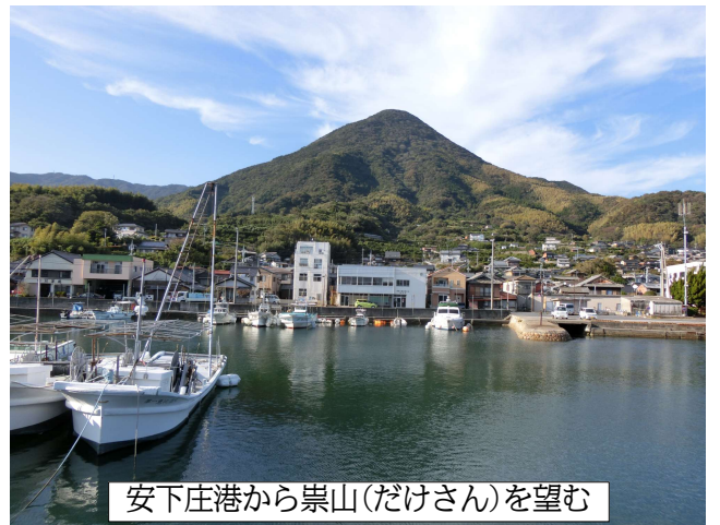
安下庄港から崇山(だけさん)を望む

ヨットマンのお二人を福音丸記念会堂（現 花咲く郷 祈りの家）にお連れして、山口さんとも良き交わりの時が与えられ、神さまがすべてを整えてくださったからこそ、ここまで来ることができた、感謝でいっぱいでした。海の状態は毎日違い、特にこれからの季節は風が強くて、船で行けない日のほうが多いかもしれません。今年最後になるかもしれない、十月は、一人で中島に、そして、翌日、先月の航