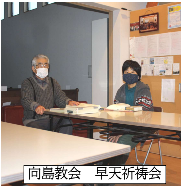
向島教会 早天祈祷会