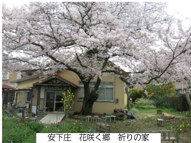
安下庄 花咲く郷 祈りの家