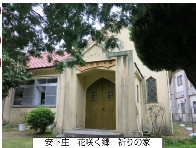
安下庄 花咲く郷 祈りの家

会につけた名前です。〈花咲く郷〉とは、遺された教会境内から受けた第一印象に、私たちが関わって来た3・11東日本大震災被災者へのNHK応援歌「花は咲く」を重ね、〈祈りの家〉は、祈りの心を抱く謙遜な人々の集いと交流の場という願いを込めたものです。現在の施設役員はカトリック信徒3名と支援の滋賀比叡山系仏教者2名。安下庄のある周防大島に常在管理しているのは私一人の心細さですが、支えて下さる方々は地元にも、広島・滋賀の役員それぞれの周りにも多数おられます。