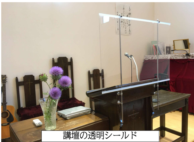
講壇の透明シールド

ラブルがありましたが、本配信を始めてからはほぼ継続的に配信できています。動画の画質や音質にこだわった配信が行われている教会もあるようですが、会堂での礼拝の代替手段と割り切り、基本機能だけを用いて簡単な操作で配信できることを重視しました。感染の拡大時期には、自宅にインターネット環境がある方はできるだけ自宅で礼拝していただくよう奨励しました。自宅にインターネット環境のない方々（主に高齢者）が礼拝に優先的に集まることができるようにするため、感染時に重症化する可能性が高い高齢者の方々の感染の機会をできる限り少なくするためでした。数家族がリモートで礼拝に参加しましたが、一方、会堂で礼拝をささげたいと強く希望される方々も多く、衛生対策をしっかりと行